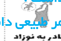
مادر به نوزاد