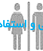
سرویس بهداشتی مشترک