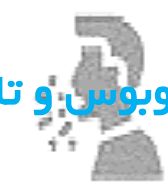
ترشحات مخاطی و عطسه