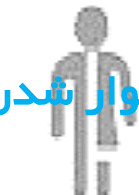
پوشیدن لباس مشترک